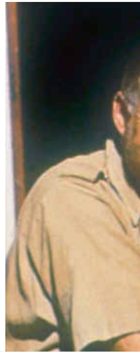
Die Lebensumstände in höherem Alter veranlassten sie, von eigener Hand aus dem Leben zu gehen: Sigmund Freud, Ernst Ludwig Kirchner,