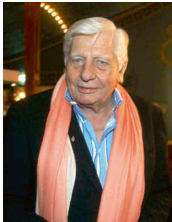
Ernest Hemingway, Hannelore Kohl, Gunter Sachs (v.l.).