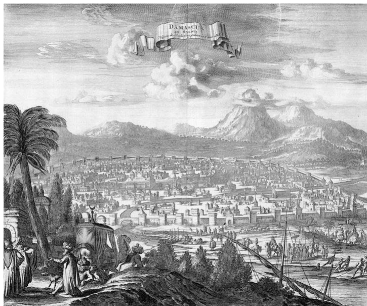
Olfert Dapper 1677

Altstadt von Damaskus als UN-Weltkulturerbe seit 1979