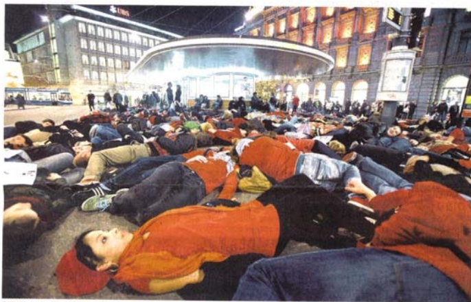
Plötzlich da. Per SMS mobilisierter «Smart Mob» auf dem Zürcher Paradeplatz als Protest gegen Kriegsmaterialexporte.